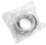
Tartalék PLA utántöltők